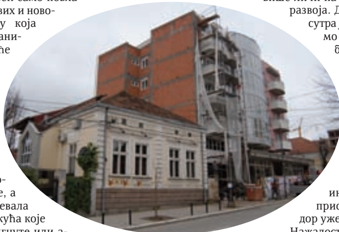
ЛЕПОТА ЗАКЛОЊЕНА СТРИМ РАВНИМ ЗИДОВИМА

Нажалост, није само Главна улица у таквом стању. Слично се дешава у скоро целој централној зони града. Хоће ли људи који планирају и „оверавају“ ново градитељство коначно схватити шта остављају будућим генерацијама, какву им слику о себи преносимо с почетка 21. века.