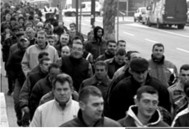
РАДНИЦИ ДОЛАЗЕ НА ПРОТЕСТ