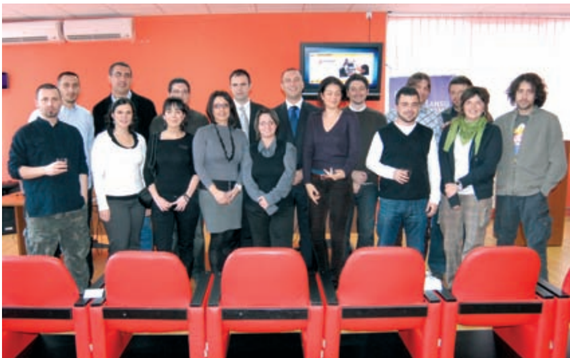
ЗАПОСЛЕНИЦИ ПРЕДУЗЕЋИМА ОЈАС УС МЕШТЕНАУ „ИНКУБАТОРУ”