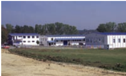
„ТРНАВА ПРОМЕТ” ДИСТРИБУЦИОНА ПУЛОВАЛА

Холдинг „Застава возила” заузео је 56. место на листи по пословном приходу, који је износио 9,57 милијарди динара. „Еконо-