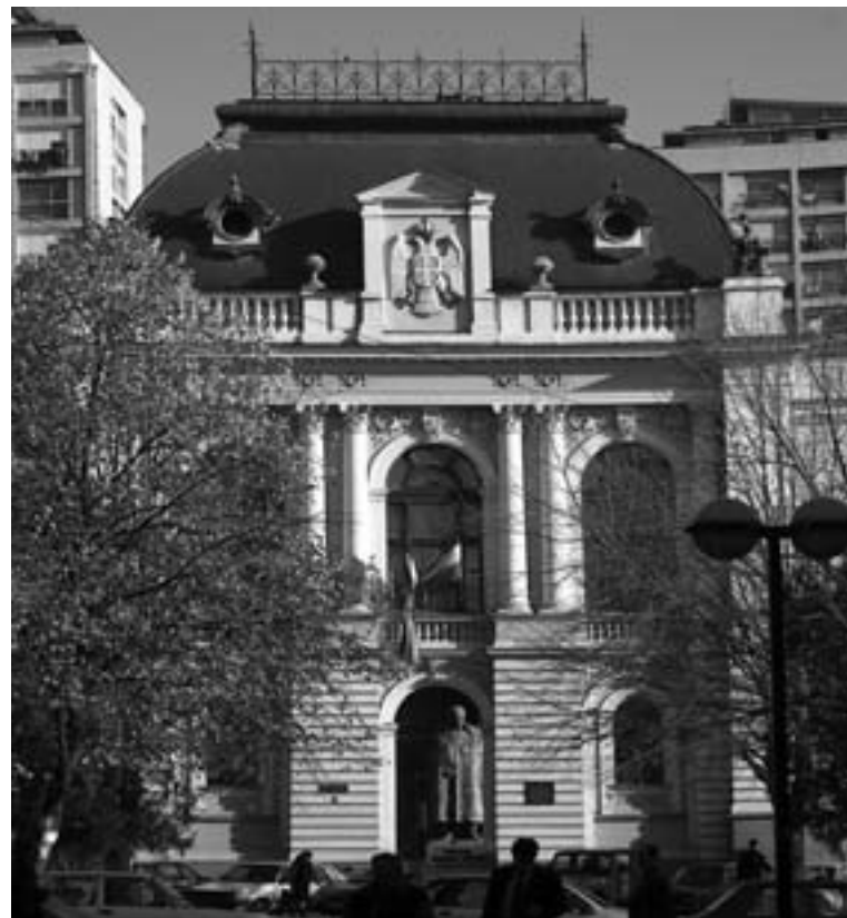
У СУДОВИМА КАДРОВИ СА СВИХ СТРАНА