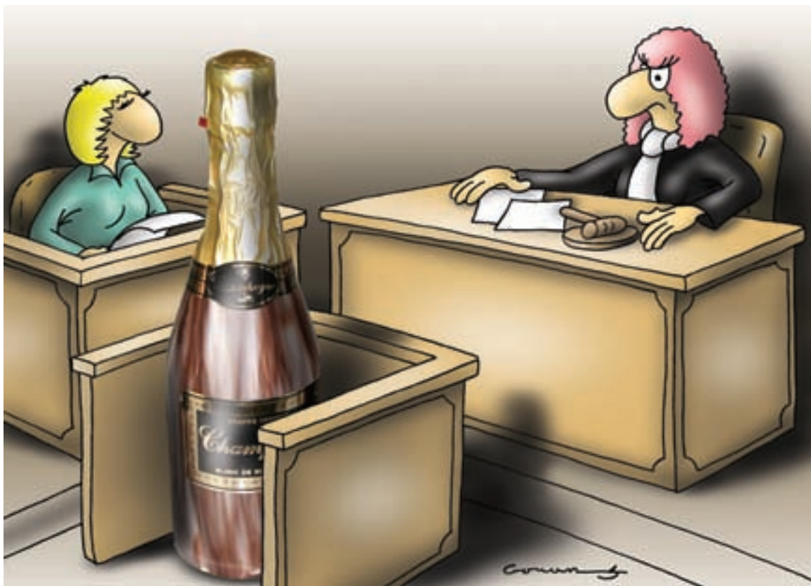
Карикатура: Горан Миленковић