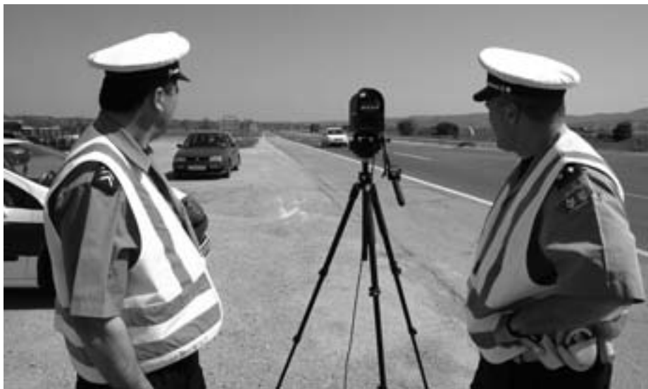
ВОЗАЧИ, ОД СУТРА ПАМЕТ У ГЛАВУ

Казнени поени су, и поред исцрпних објашњења у Закону, још у-