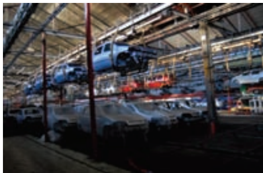
„ЗАСТАВА ВОЗИЛА” ИС ПУЛОВАЛА НАЈВЕЋИМ БРОЈЕМ ЗАПОСЛЕНИХ

ходом од 6,84 милијарде динара, што је за 38,3 одсто више него претпрошле године. Ова фирма која се бави увозом и дистрибуцијом препарата за заштиту биља и вештачких ђубрива, а већински је власник још неколико предузећа у Србији, повећала је и број запо-