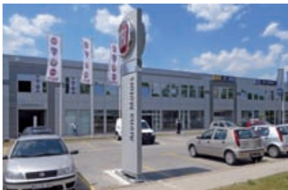
„ЗАСТАВА ПРОМЕТ – АРЕНА МОТОРС” ЗАДРЖАЛА ПОЗИЦИЈУ НАЈВЕЋИХ

87. место на листи и поправило пласман за 12 позиција у односу на 2007. годину, са пословним при-