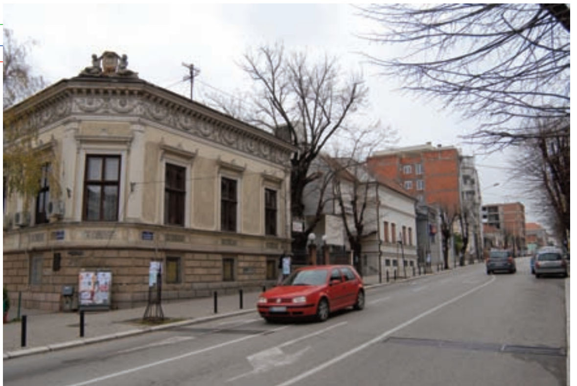
ЛЕВА СТРАНА ГЛАВНЕ УЛИЦЕ ЛИЧИ НА КАСКАДЕ

Он упућује и на кривце за описано стање – на урбани-