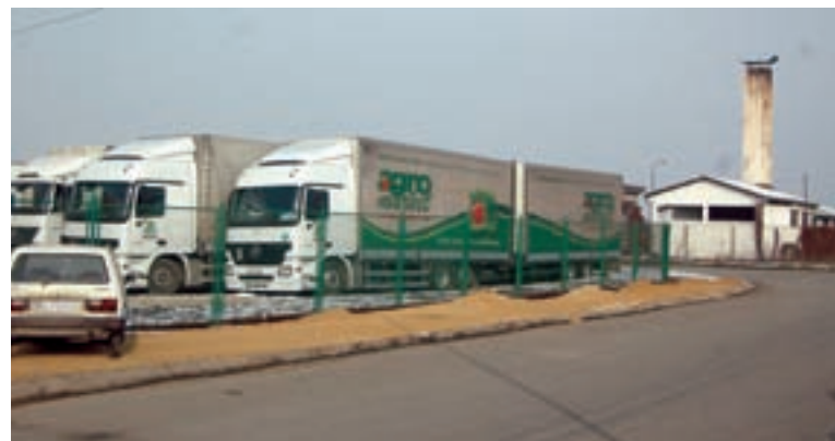
„АГРОМАРКЕТ” ПУЛОВАЛА НАЈВЕЋИМ БРОЈЕМ ЗАПОСЛЕНИХ

добитак са 75 на 99 милиона динара. За разлику од тог предузећа, „Застава промет – Арена моторс” је пала за 39 места и сада је на 297. позицији, али се одржала међу 300 највећих, што је такође успех. Фирма је имала пословни