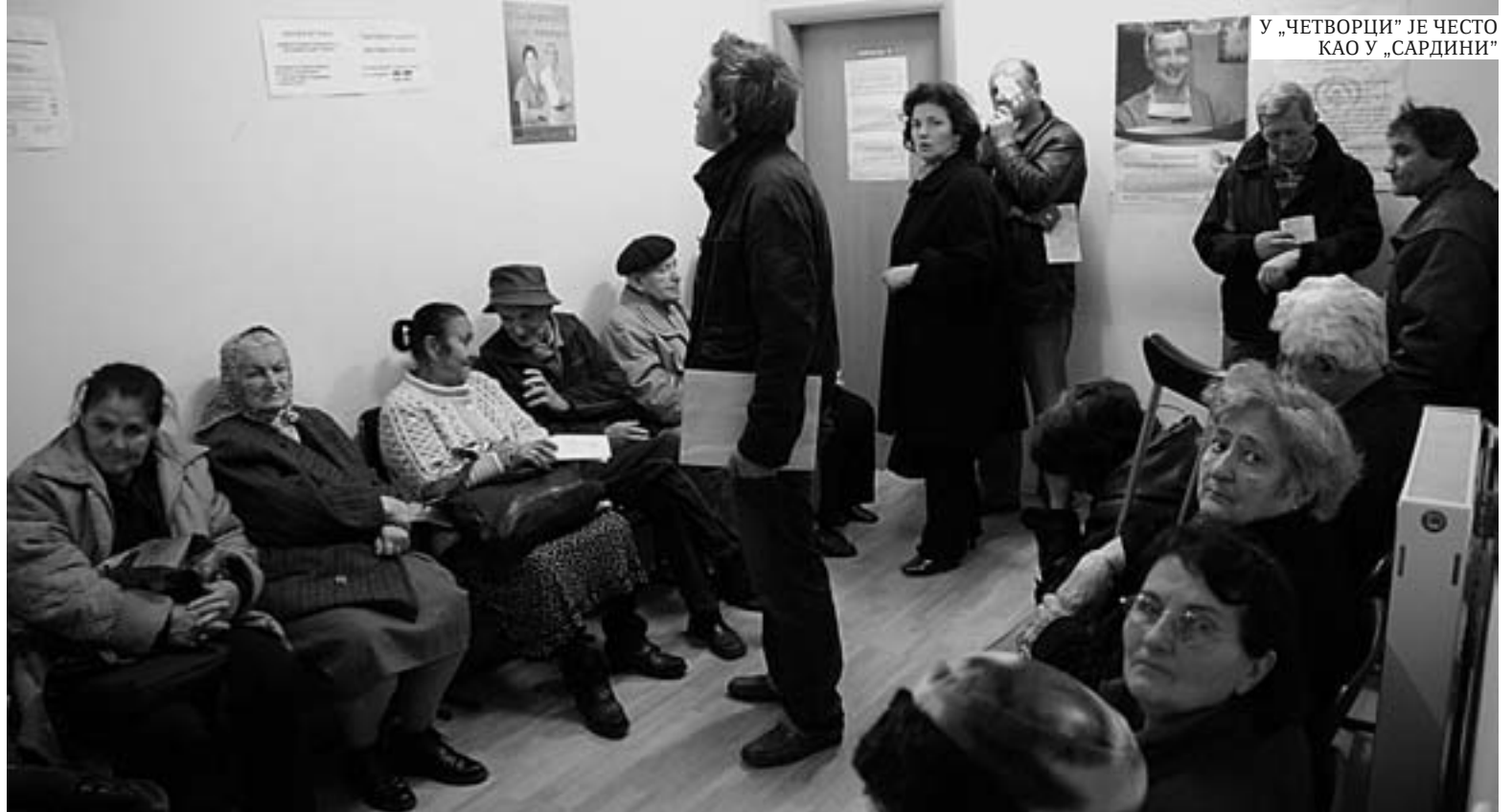
У „ЧЕТВОРЦИ” ЈЕ ЧЕСТО КАО У „САРДИНИ”

- Дошла сам у пет јутрос и још чекам, а од нас је неколико, улазе преко реда, па остају по пола са-