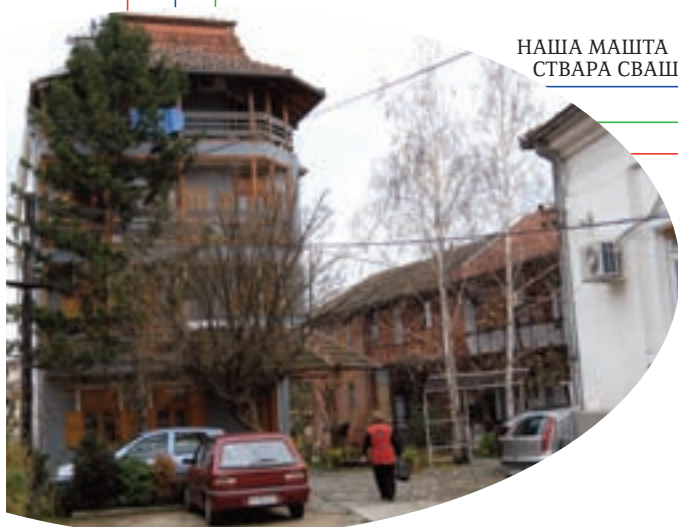
НАША МАШТА СТВАРА СВАШТА