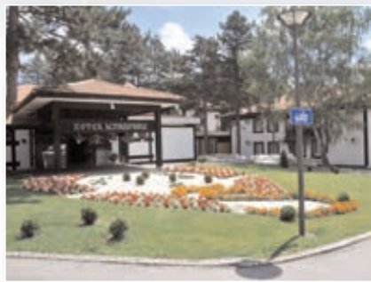
СПЛАСНУО ХОТЕЛИЈЕРСКИ БУМ У КРАГУЈЕВЦУ