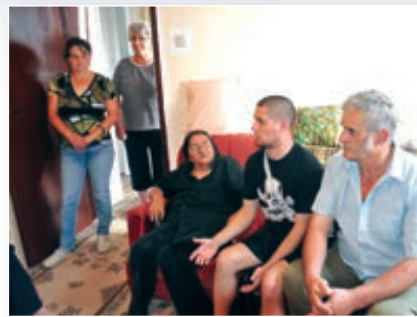
ЗАТВОРЕНИК ИЗ ЗАБЕЛЕ УБИО КОМШИНИЦУ