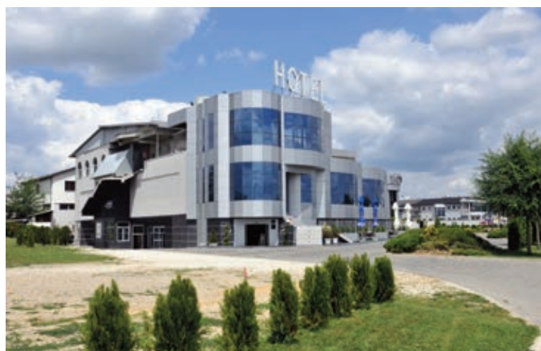
„ЖЕНЕВА ЛУКС“ ГОСТЕ ПРИВЛАЧИ ПУТЕМ ИНТЕРНЕТА