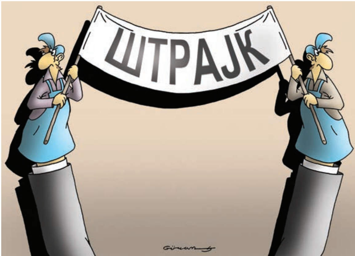
Карикатура: Горан Миленковић