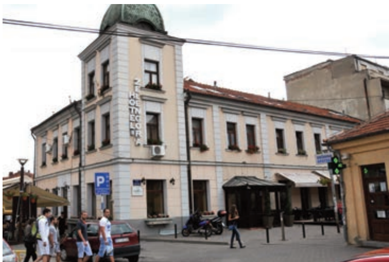
ХОТЕЛ „ЗЕЛЕНГОРА” ДО СКОРО ПРЕПУН, САДА ПОПУЊЕН 70 ПОСТО

Мислим да граду, уколико не дође до значајнијих привредних активности и већих инвестиција, неће тре-