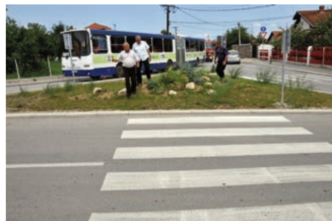
ЗЕЛЕНИЛО НА ПЕШАЧКОМ ОСТРВУ КОМПЛИКУЈЕ ПРЕЛАЗ ПЕШАКА

Протекло је време, а тек у фебруару ове године на тендеру је прошла фирма из Сомбора „Сигнал“ д.о.о,