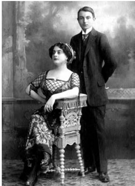
КНЕЗ ПАВЛЕ СА ТЕТКОМ МИОНОМ 1913. У РИМУ

Павле Карађорђевић рођен је у Петровграду 18. априла 1893. године, од оца Арсена Карађорђевића и мајке Ауроре Демидов, која је била племићског порекла. Из Русије је отишао када је имао само годину дана са неговатељицом, Рускињом, а са свега три године прихватио га је стриц Петар Карађорђевић, који је после трагичне смрти своје жене Зорке и сина Андрије напустио