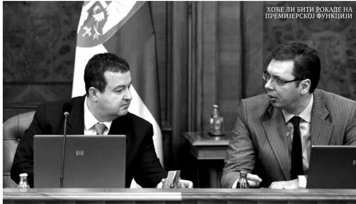
ХОЋЕ ЛИ БИТИ РОКАДЕ НА ПРЕМИЈЕРСКОЈ ФУНКЦИЈИ