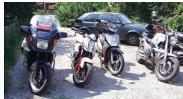
СЛЕДЕ ПРОВЕРЕ ЛЕГАЛНОСТИ ЧЕТИРИ МОТОЦИКЛА И „МЕРЦЕДЕСА“