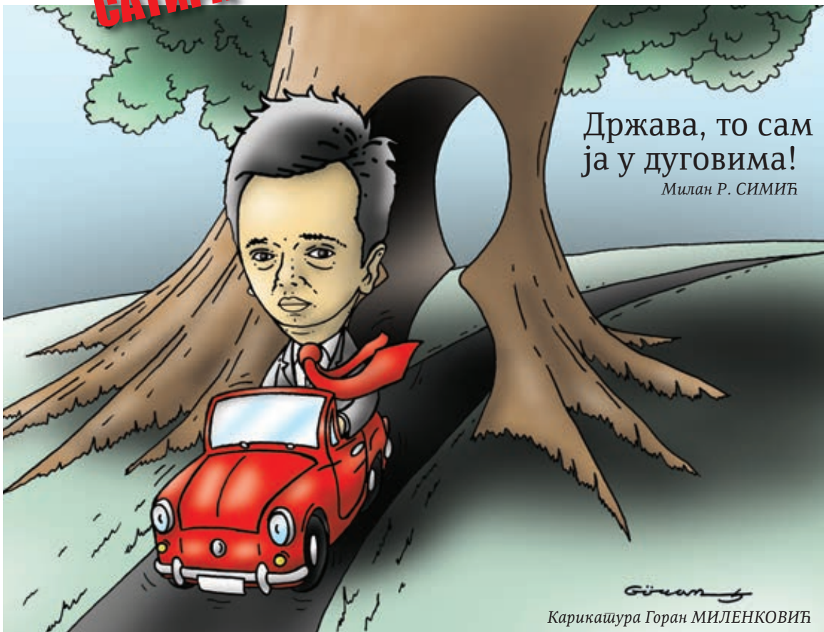
Карикашура Горан МИЛЕНКОВИЋ