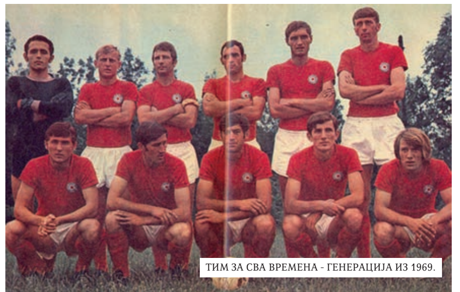
ТИМ ЗА СВА ВРЕМЕНА - ГЕНЕРАЦИЈА ИЗ 1969.