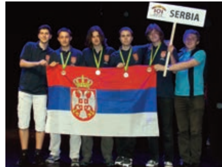
СРПСКА РЕПРЕЗЕНТАЦИЈА ИНФОРМАТИЧАРА У БРИЗБЕЈНУ

Такмичење, на коме су учествовали тимови из 81 земље, српски