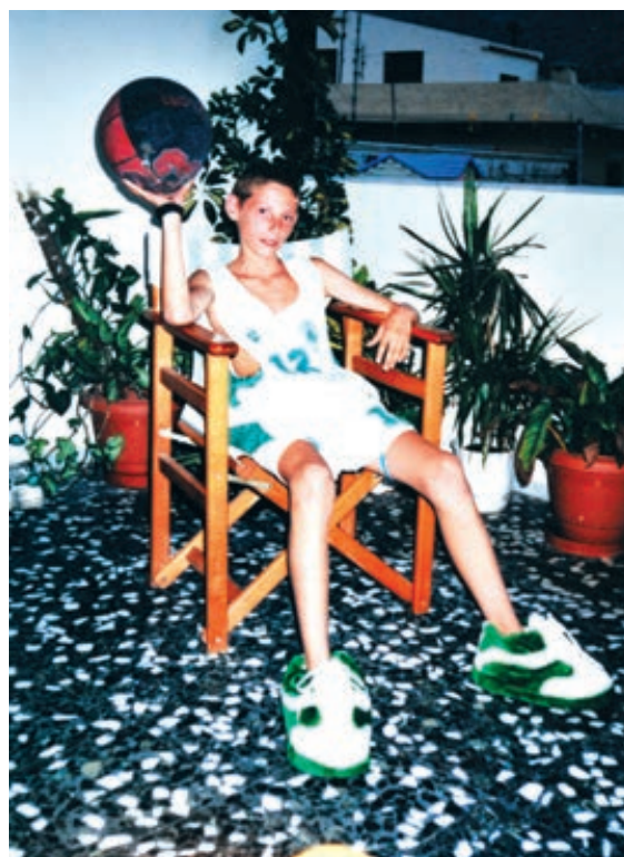
КАО ДЕЧАК, У ДОМУ КАБУРАКИКА, У ДРЕСУ „ПАНТЕНАИКОСА“

Шта се после свих лепих и срећно проведених година може још пожелети овом временском брачном пару него да од платинасте дочекају и дијамантску свадбу.