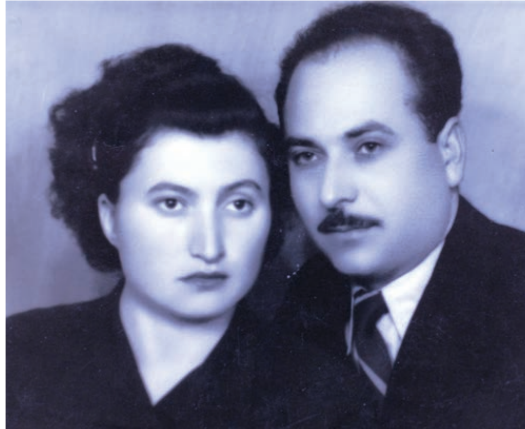
СВАДБЕНА СЛИКА ПРЕ ШЕЗДЕСЕТ ГОДИНА