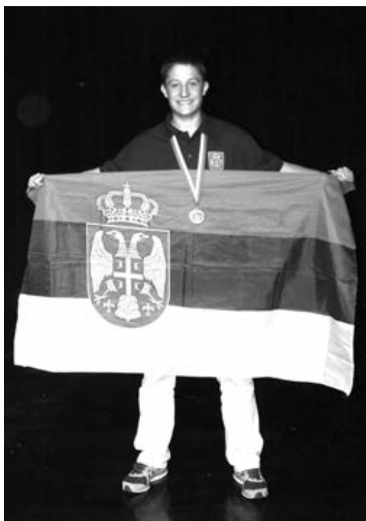
МАРКО КАЖЕ ДА ЈЕ ЗАДОВОЉАН ПЛАСМАНОМ

Иако нису донели прво злато за Србију, коме су се наши олимпијци ове године надали, нису разочара-