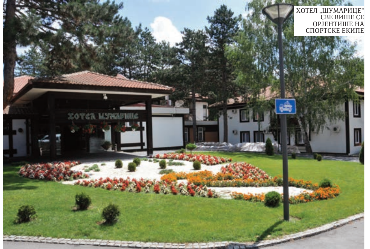
ХОТЕЛ „ШУМАРИЦЕ” СВЕ ВИШЕ СЕ ОРЈЕНТИШЕ НА СПОРТСКЕ ЕКИПЕ

Велики број страних гостију чии укус не задовољавају скромни хотели натерало је локалну самоуправу да се озбиљно позабави овим