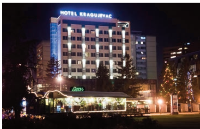
ХОТЕЛ „КРАГУЈЕВАЦ“ БИО ПОПУЊЕНИИ ЗА ВРЕМЕ РЕКОНСТРУКЦИЈЕ

••• бати нови хотелски капацитети. Посебно неће бити потребе за изградњом луксузних објеката са пет и више звездица, јер Крагујевац не може да привуче довољно клијентеле спремне да издвоји 150 евра за ноћење. Тога су свесни и потенцијални инвеститори који, упркос отвореној понуди града и обећаним бенефицијама, нису вољни да уложе десетине милиона евра у хотел који ће стајати празан. Са друге стране то би сигурно довело до повећања цена смештаја у нижекатегоризованим објектима, јер би наспрам 150 евра за ноћ понуда од 75, што је дупло више од тренутне цене, за нешто мањи конфор била прихватљива, објашњава Марјановић.