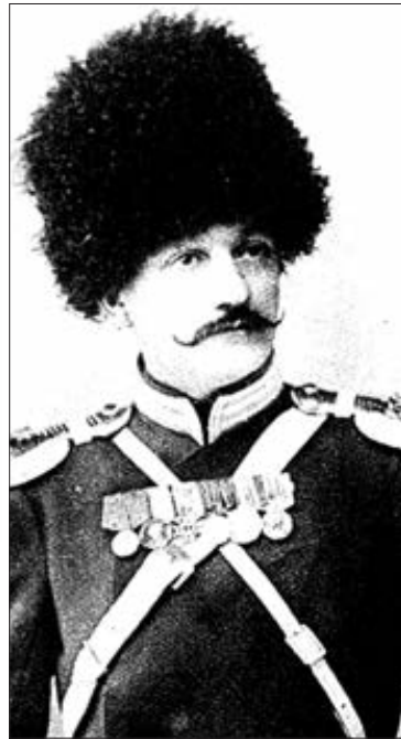
ПАВЛЕ КАРАЂОРЂЕВИЋ И АУРОРА ДЕМИДОВ – ОТАЦ И МАЈКА КНЕЗА ПАВЛА