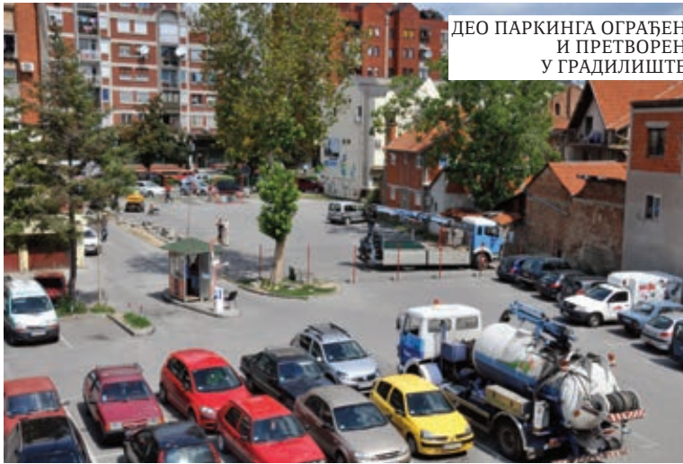
ДЕО ПАРКИНГА ОГРАЂЕН И ПРЕТВОРЕН У ГРАДИЛИШТЕ

Градски челници су покретање истраге оквалификовали као још један у низу атака на инвестиције у Крагујевцу, наглашавајући да је све урађено по закону, као и да једнострано раскид уговора није био у инте-