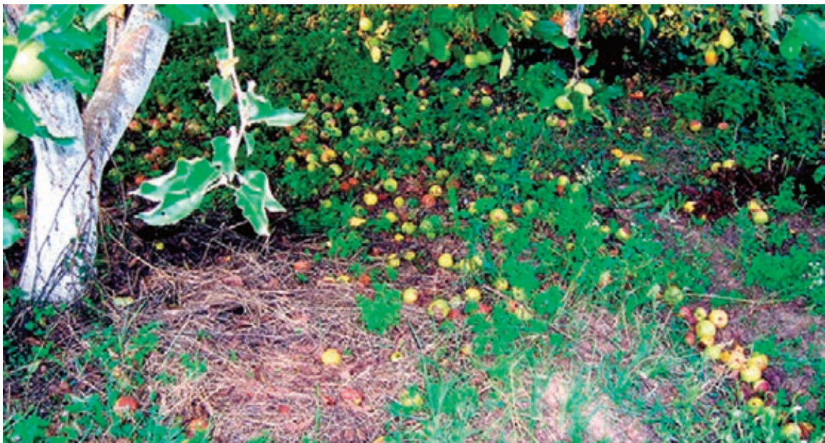
ГРАД „ОБРАО“ ЈАБУКЕ ПРЕ ВРЕМЕНА

То практично значи да би сезона у Србији требало да стартује са 20.000 ракета. Подаци које смо добили из Сектора за ванредне ситуације МУП-а Србије говоре да је овај Сектор, задужен и за противградну заштиту, у ову сезону ушао са 5.672 ракете, а да је потом набављено још 3.800 пројектила. У 50 општина у Србији, иако им то није законска обавеза, сопственим средствима је набављено