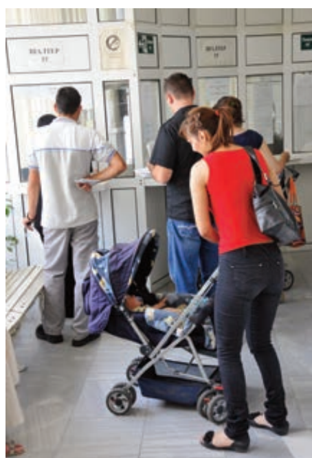
РОДИТЕЉИ ИСПРЕД ШАЛТЕРА У ПОРЕСКОЈ УПРАВИ