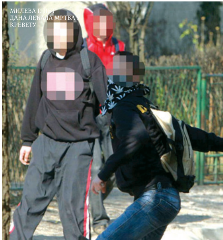
МИЛЕВА Г. И НИЧЕ ДАНА ЛЕБАДА МРТВА КРЕВЕТУ

наставио са вршењем кривичних дела", каже се у полицијском саопштењу.