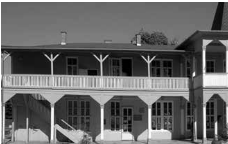
РЕКОНСТРУКЦИЈУ СОКОЛАНЕ ФИНАНСИРАЛА ЈЕ ЈУЖНОМОРАВСКА РЕГИЈА

Она је нагласила да су осим финансијске помоћи још значајнији били одласци представника локалних самоуправа у Брну, што је