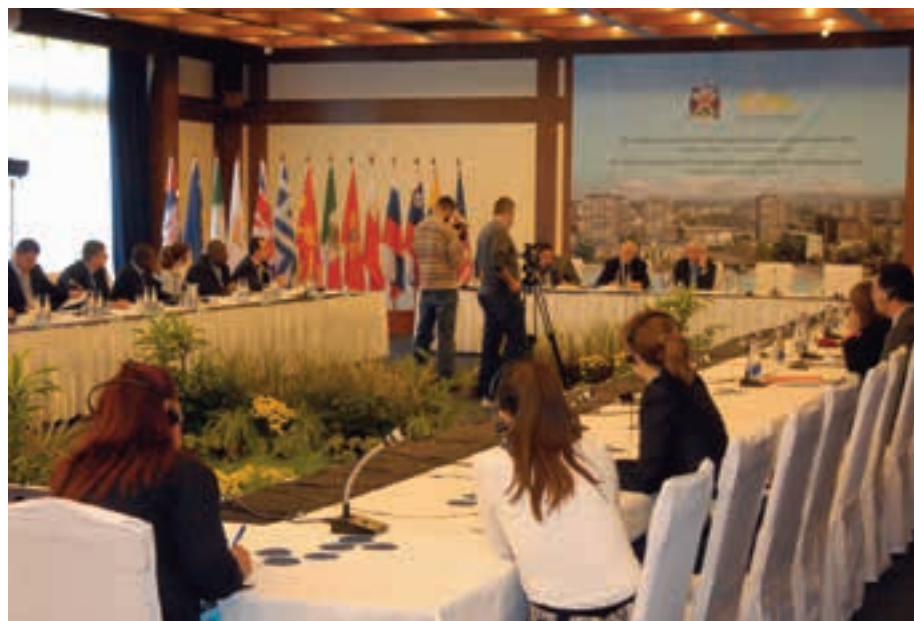
СЕДНИЦА ГЕНЕРАЛНЕ СКУПШТИНЕ АСОЦИЈАЦИЈЕ ГРАДОВА ВЕСНИКА МИРА