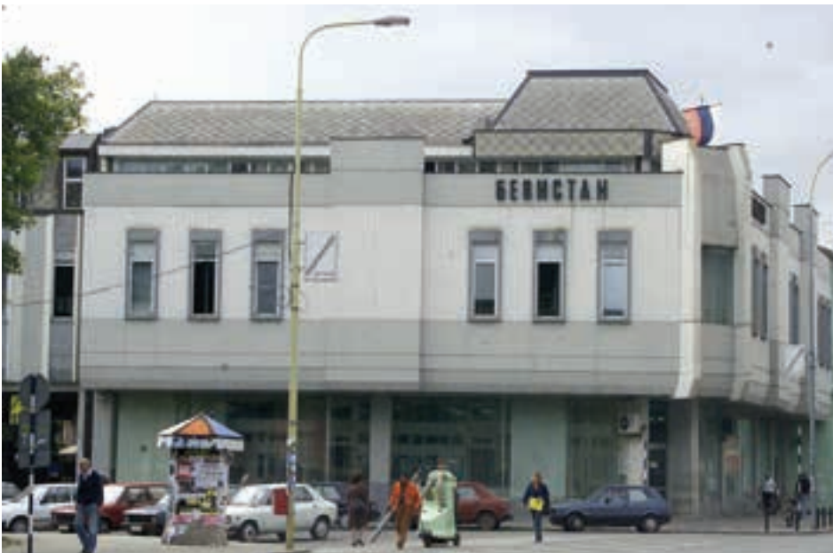
ЗГРАДА ФИЛИЈАЛЕ ПОРЕСКЕ УПРАВЕ У КРАГУЈЕВЦУ