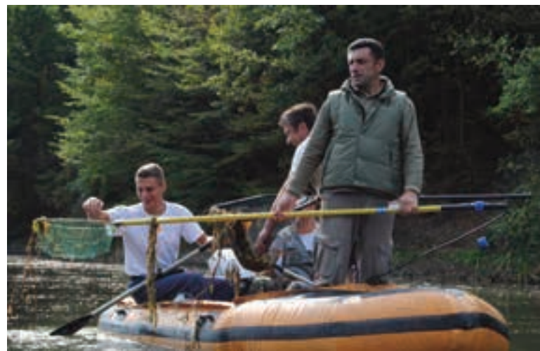
ИСТРАЖИВАЊЕ НА ЈЕЗЕРУ МЕТОДОМ ЕЛЕКТРОРИБОЛОВА

Вода прве класе карактеристична је по великом броју врста и разноврсности заступљеној у њеној флори и фауни, док је у четвртој класи присутан мали број врста (од једне до три), али је у тим сре-