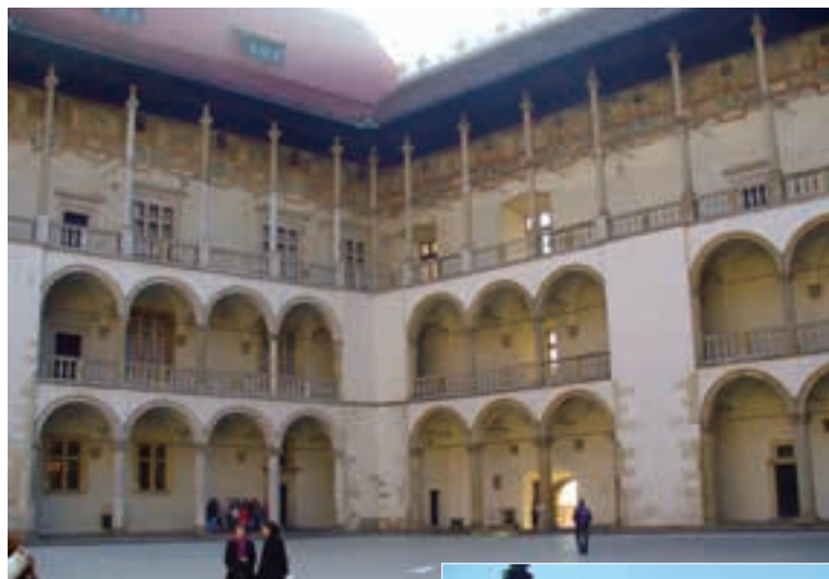
КРАЉЕВСКИ ДВОРАЦ НА БРДУ ВАВЕЛ

ће делује податак да на скоро свака четири становника дође један студент.