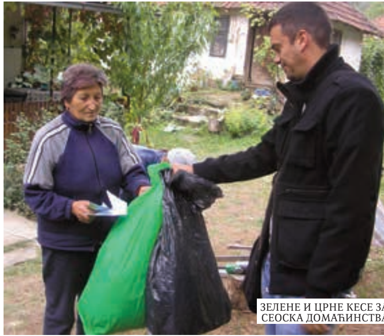
ЗЕЛЕНЕ И ЦРНЕ КЕСЕ ЗА СЕОСКА ДОМАЋИНСТВА

У претходном периоду делили смо обавештења, а истовремено кренули смо и са едукацијом становништва са сеоског подручја. Није реч само о одвозу, већ и о разврстава-