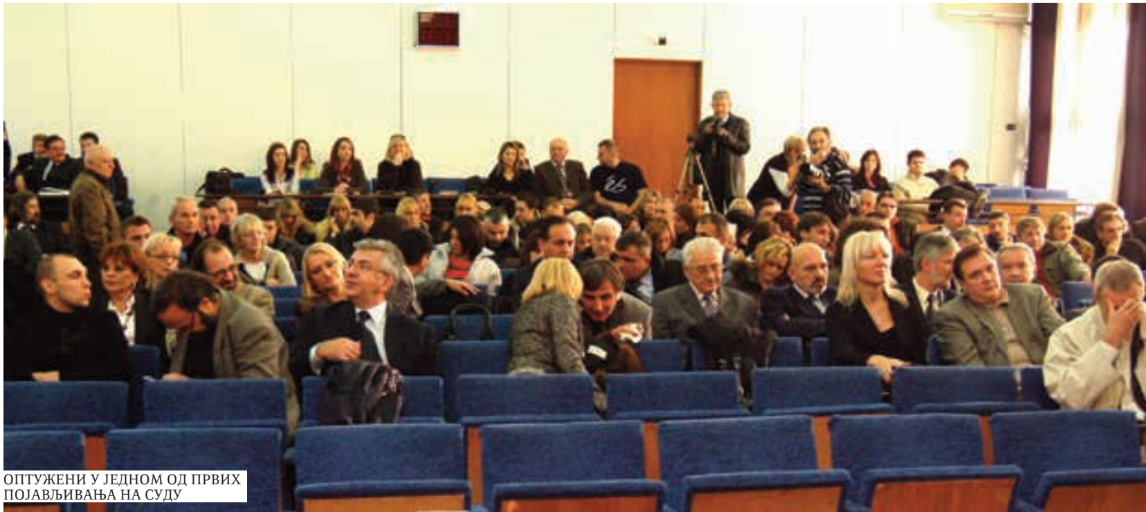
ОПТУЖЕНИ У ЈЕДНОМ ОД ПРВИХ ПОЈАВЉИВАЊА НА СУДУ