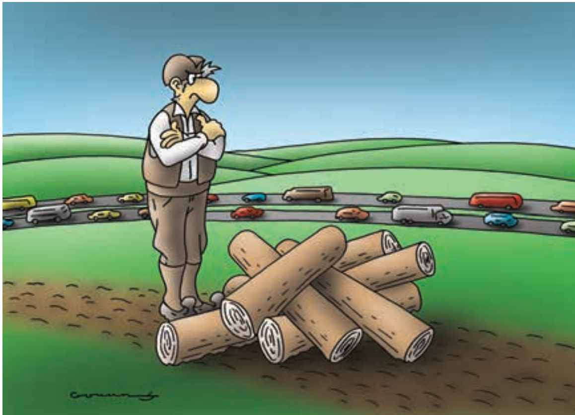
Карикатура: Горан Миленковић