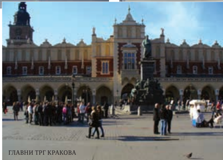
ГЛАВНИ ТРГ КРАКОВА