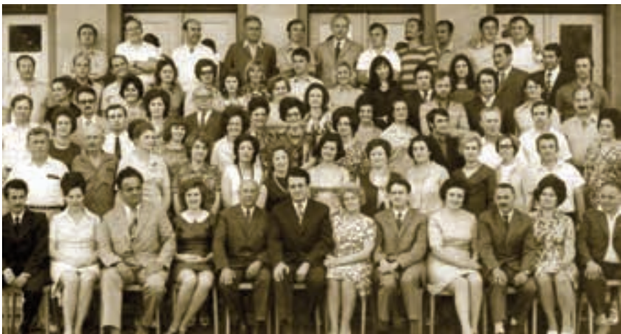
ПРОФЕСОРИ ШКОЛЕ ИЗ 1972. ГОДИНЕ