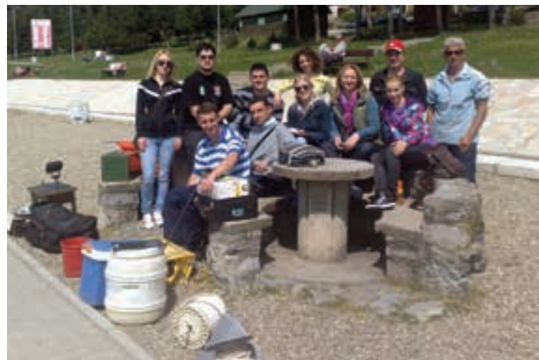
ДЕО ХИДРОБИЛОШКЕ ЕКИПЕ НА ТЕРЕНУ