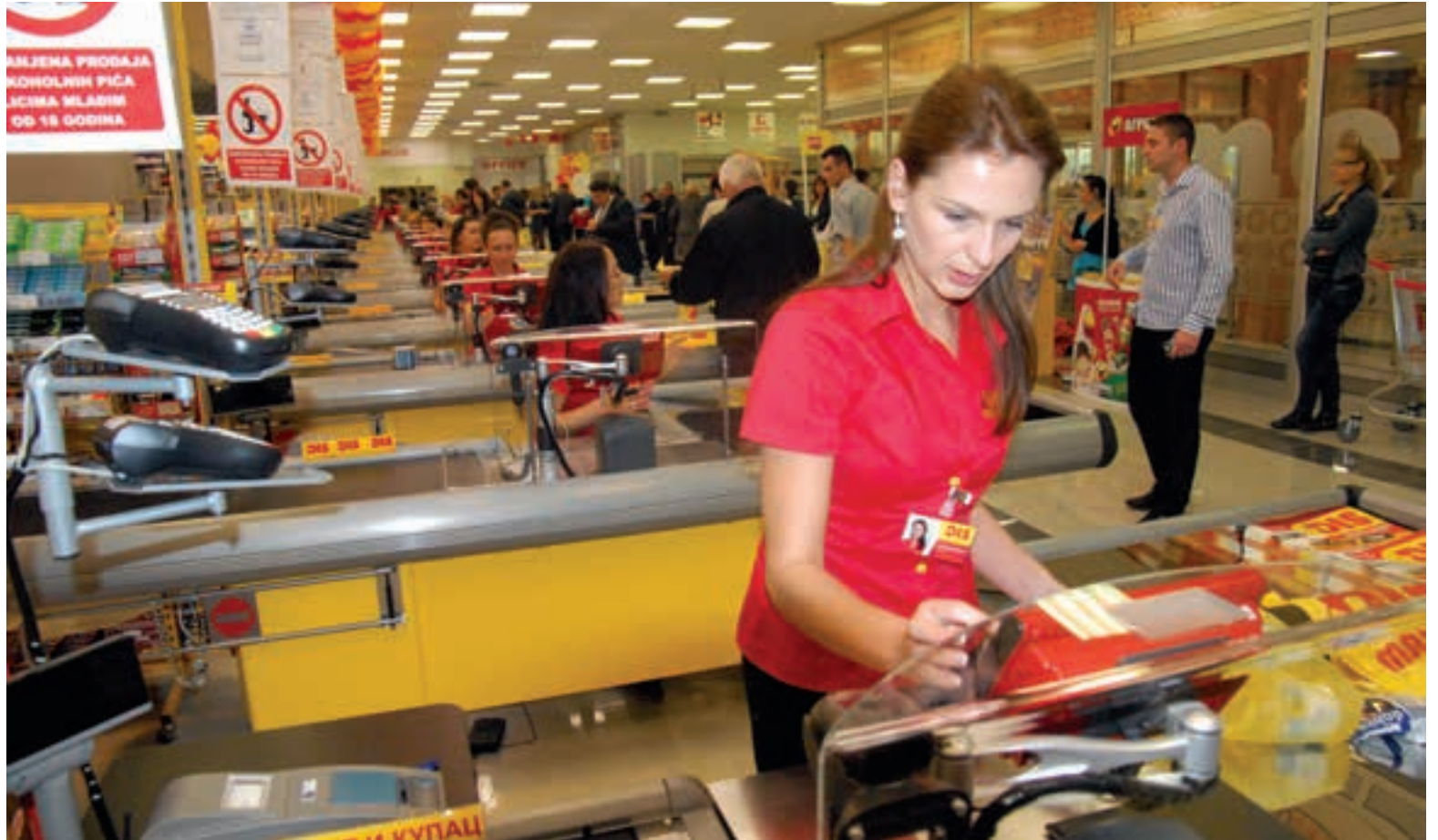
ВЕЛИКИ ТРГОВИНСКИ ЛАНЦИ УПЛАЋУЈУ ПОРЕЗЕ ПО ЗАКОНУ

Међутим, Филијала у Крагујевцу не располаже податком да ли сви ови послодавци поштују прописе и уплаћују порезе на зараде према месту пребивалишта запослених, односно да ли и колико има оних који прибегавају лакшем решењу и средства уплаћују у општину где је седиште фирме. Објашње Филијале је да