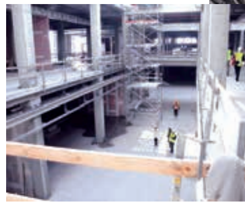
ЦЕНТРАЛНИ УНУТРАШЊИ ПРОСТОР