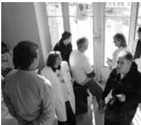
ЗА ПАЦИЕНТЕ УЛАЗ НИЈЕ ЗАТВОРЕН