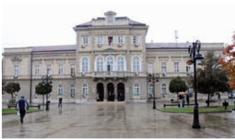
КРАГУЈЕВАЧКИ СЛУЧАЈ ЗАДАО МНОГО ПРОБЛЕМА СУДУ У СМЕДЕРЕВУ

- Поступак се одвија оном брзином у којој могућности то дозвољавају. На жалост, један од проблема је и то што овај суд има само једног тужиоца и три заменика који се по-