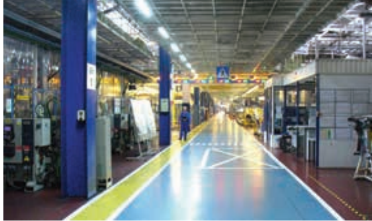
У ФАБРИЦИ „КАО У АПОТЕЦИ“

Близу два и по милиона квадрата површине, од тога пола милиона намењених производњи, 11.000 запослених, укључујући и компоненташе, извоз у 68 земаља и фабрика која заузима седам различитих локација у Пољској, само су неке од задивљујућих цифара које описују пољског гиганта. Уосталом, то је и највећа фабрика у Пољској, а друга по отвореном извозу.