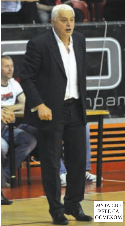
МУТА СВЕ РЕБЕ СА ОСМЕХОМ

Црногорски репрезентативац поникао је у подгоричкој Будућ-