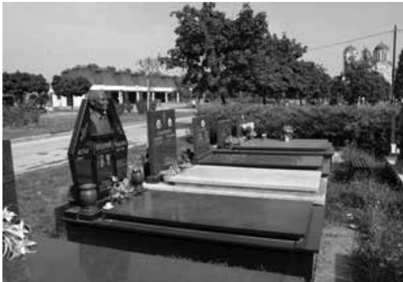
ГРОБЉЕ „БОЗМАН” ПОД ЛУПОМ УПРАВНОГ СУДА

- Нисмо се слагали са одлуком Комисије, јер није узела у обзир све релевантне податке. Ако се зна да осим „Бозмана” предузеће газдује Варошким, Палилулским и Сушичким гробљем, онда се те издвојене парцеле односе на укупно