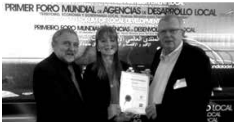
ДОДЕЛА ПРИЗНАЊА У СЕВИЉИ