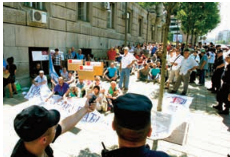
ПРОТЕСТ РАДНИКА „НИБЕНС“ ГРУПЕ ПРЕД ВЛАДОМ СРБИЈЕ

Путарска предузећа ове групе банкама дугују око 130 милиона евра, а укупно дугују око 170 милиона евра. Радници траже да се одблокирају рачуни тих предузећа како би могли да наставе да раде, да им буду исплаћене заостале зараде, да потраживања банака буду конвертована у капитал пре-