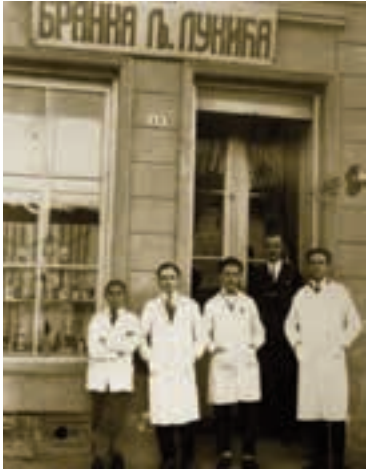
ХОЋЕ ЛИ И ЛУКИЋЕВА РАДЊА НЕСТАТИ ИЗ СТАРЕ ЧАРШИЈЕ (ИЗГЛЕД НЕКАДА И ДАНАС)