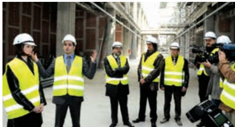
ИНВЕСТИТОРИ И ПРЕДСТАВНИЦИ ГРАДСКЕ ВЛАСТИ

зе хране, куглана, билијар сала, подземна гаража са 650 места и разни други садржаји. Ивестиција је вредна 50 милиона евра и до сада је на изградњи ангажовано 1.500 радника. Када објекат буде завршен процењује се да ће у њему бити отворено од 400 до 500 нових радних места.