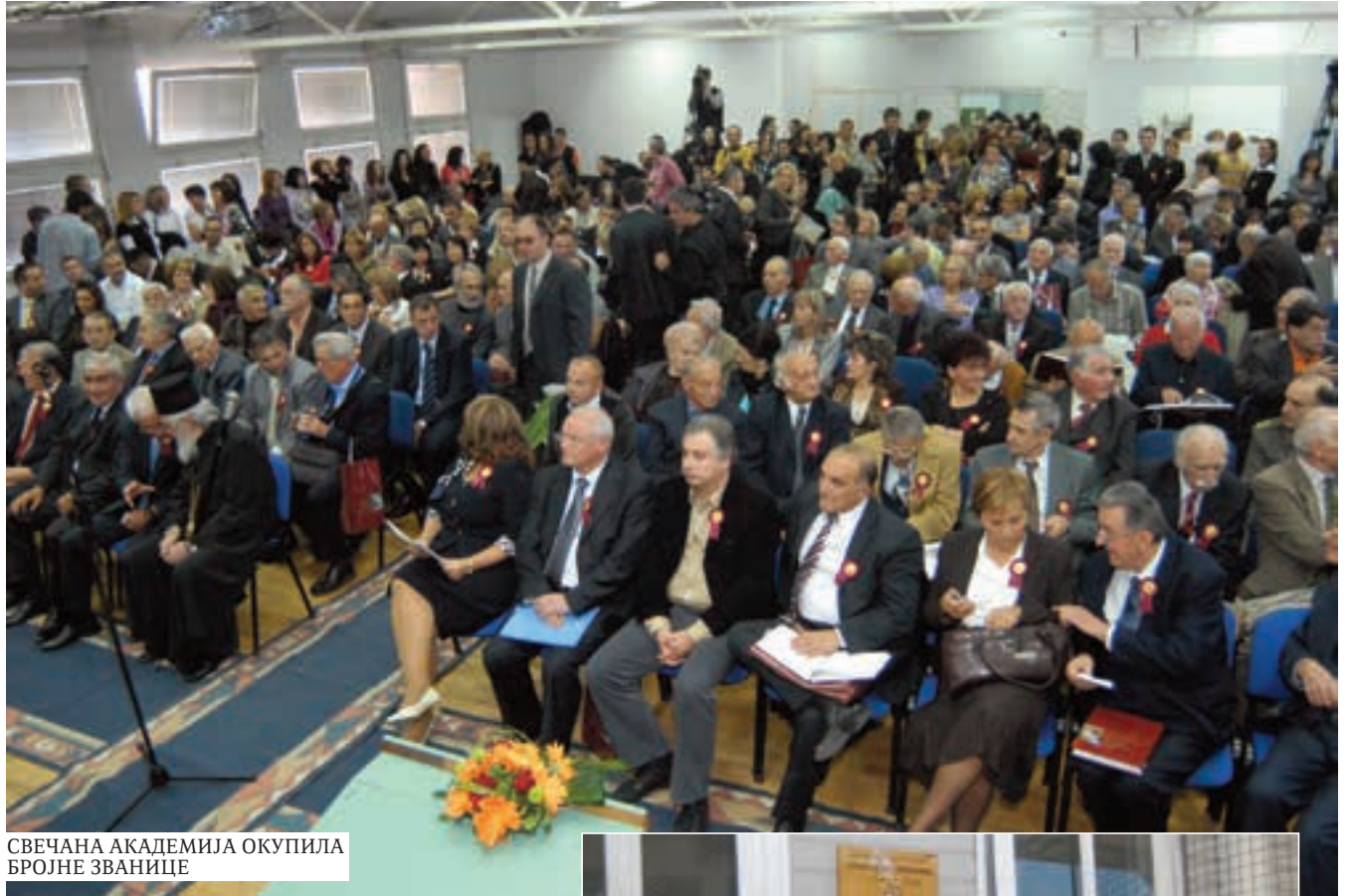
СВЕЧАНА АКАДЕМИЈА ОКУПИЛА БРОЈНЕ ЗВАНИЦЕ

У осму деценију постојања школа улази са око 1.400 ђака и 53 одељења. Од мале бараке израсла је у модерну школу, којој је шездесе-