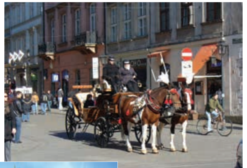
КОЧИЈЕ ПРИВЛАЧЕ ТУРИСТЕ

чима даје одрешене руке, па се за десет евра може добити од 30 до 43 злота, зависно у коју се мењачницу уђе. Цене такође варирају, па се на једном месту пиће може попипати за два и по евра, а негде и за око 110 динара, преведено у нашу валуту.