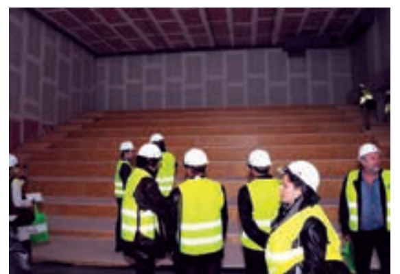
ЈЕДНА ОД БУДУЋИХ БИОСКОПСКИХ САЛА