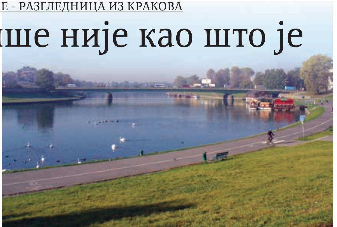
БЕСПРЕКОРНО УРЕЂЕНА ОБАЛА ВИСЛЕ

Богата историја и традиција и даље се негују, што је уз уредност била и остала главна одлика Пољака и Кракова, који живи у знаку своје најпознатије личности, папе Јована Павла. У поређењу са некадашњим општим сиромаштвом земља се данас може описати речју - стабилна