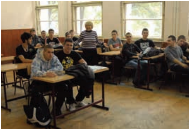
САДАШЊИ ЂАЦИ ПРВЕ ТЕХНИЧКЕ