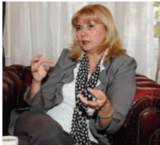
СУДИЈА СЛАЂАНА БОЈКОВИЋ