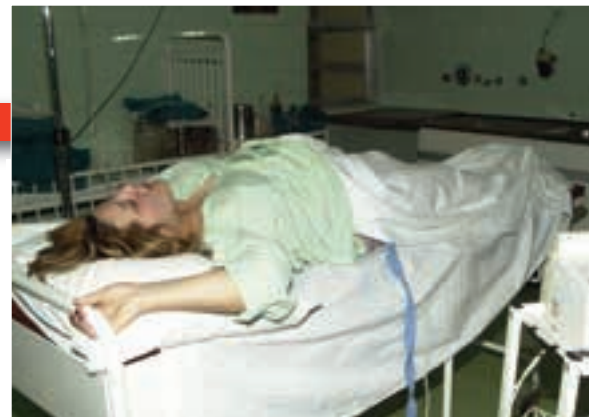
УСЛУГЕ НАПЛАЊИВАНЕ И ОД ПОРОДИЉА И ОД ЗАВОДА

Не треба бити много паметан па посумњати да су фармацеутски лобији умешали своје прсте. То, међутим, неће моћи да открије најављена буџетска инспекција, јер она може једино да контролише да ли се средства наменски троше. Ако ствари заиста морају да се истерају на чистац, несудебни крагујевачки Хјустон требао би да посети други органи.