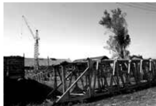
МНОГЕ ПРИВАТИЗОВАНЕ ФИРМЕ ЗАВРШИЛЕ СУ НА ФУРДИ

Истовремено, на крају јуна било је незапослено укупно 756.255 лица, од којих 394.963 жена, што је за 1,3 одсто више у односу на исти месец претходне године. Јунска стопа реги-