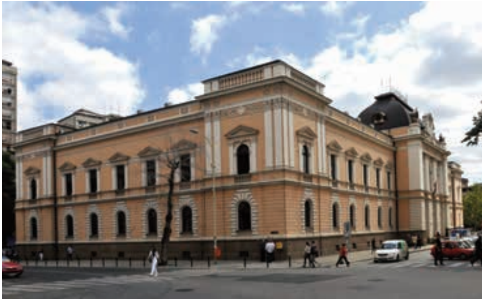
НА КОНАЧНИ СТАТУС ЧЕКА ЈОШ 10 ОД НЕКАДАШЊИХ 39 СУДИЈА ОПШТИНСКОГ СУДА

Највише ми је засметало што у образложењу стоји да су изабрани они који кумулативно испуњавају сва три услова: стручност, достојност и оспособљеност. То би требало да значи да су најбољи из струке прошли, што није случај. Требало би негде да изају резултати свих нас да би сами могли да се упоредимо.