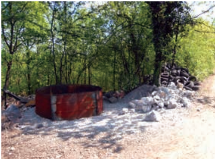
НА ДИВЉИМ СЕОСКИМ ДЕПОНИЈАМА ОТПАД СЕ СПАЉУЈЕ

- Сакупљање и одлагање комуналног и амбалажног отпада у сеоским подручјима вршиће се системом кеса, које ћемо делити домаћинствима, и прикупљањем са сабирних места која су унапред утврђена. Било је нереално очекивати да камионом можемо да дођемо до сваког засеока и дво-