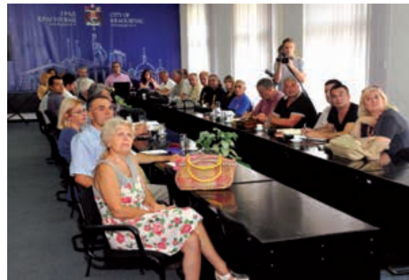
УРУЧИВАЊЕ УГОВОРА ЕКОЛОШКИМ УДРУЖЕЊИМА

Финансира се и пројекат „Истраживање и очување извора питке воде на подручју Жежеља и Бешваје” који је поднео Планинарско еколошки клуб „Гора”. За истраживање и промовисање био-