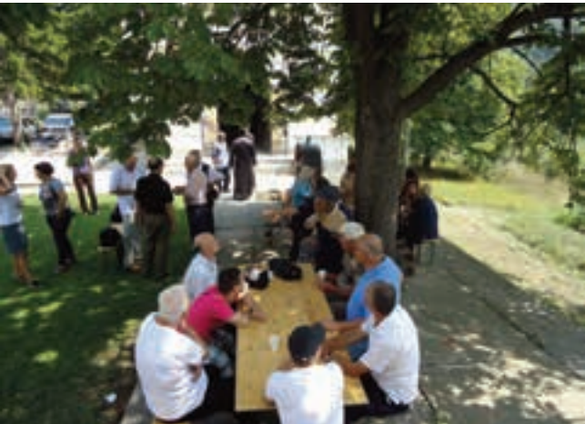
ПОРОДИЧНИ СКУП У ПОРТИ ЦРКВЕ