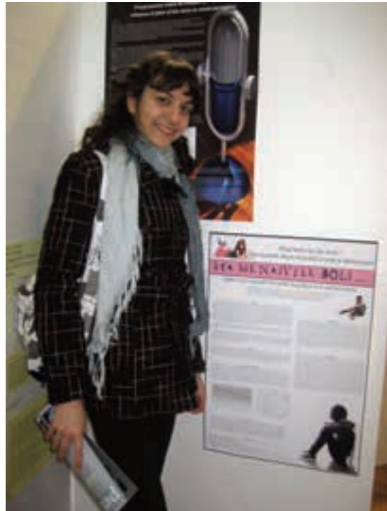
У ПЕТНИЦИ ПРЕДАЈЕ МЛАЂИМ ПОЛАЗНИЦИМА

Наредне године очекује је неки нови пројекат, али још нема идеју која ће то тема бити. Највероватније ће радити интервјуе са десетак својих испитаника о логичном приступу решавања задатака, како би се видело да ли они само умеју да реше задатке, или умеју и да вербализују своје способности, што би била нека надградња. За њу је овај последњи рад имао највећу научну дубину и био је најзахтев-