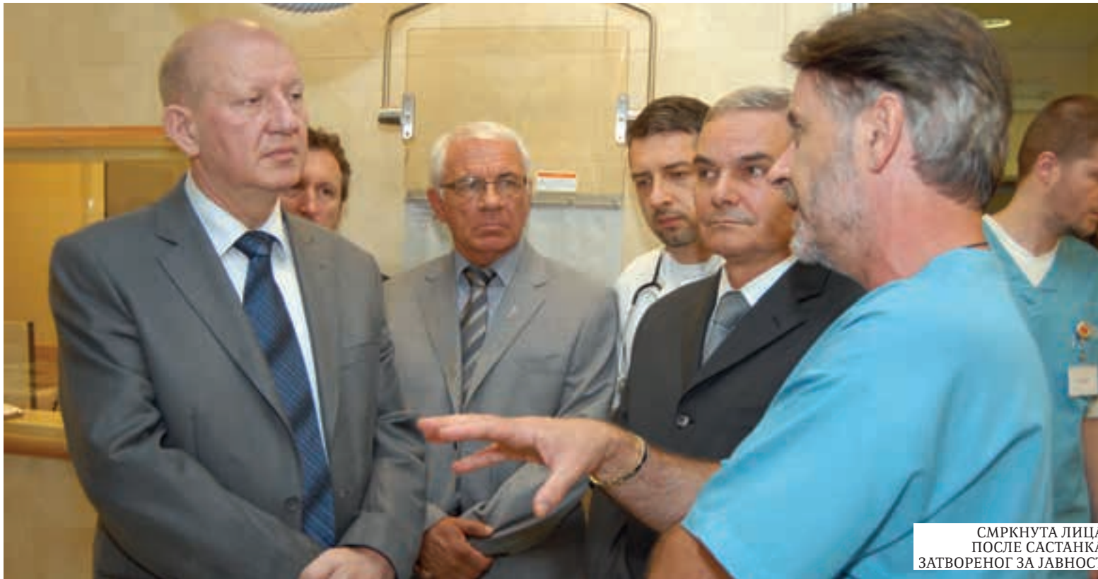
СМРКНУТА ЛИЦА ПОСЛЕ САСТАНКА ЗАТВОРЕНОГ ЗА ЈАВНОСТ

следнику на располагању оставио више стотина милиона динара.