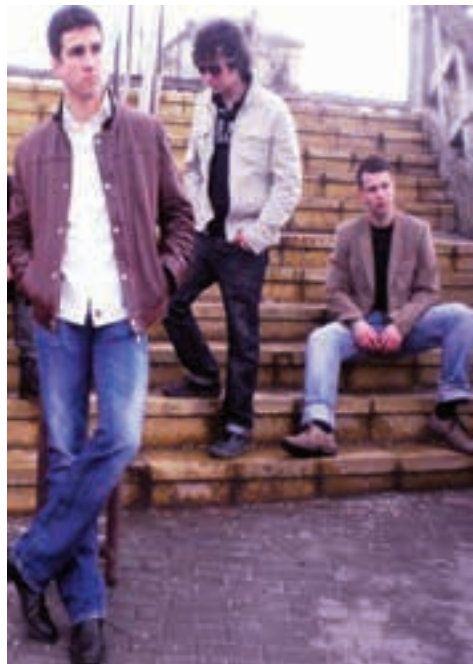
КРАГУЈЕВАЧКА ГРУПА „ФЛОЈД“ ПЕВА ПЕСМУ „ПОСЛЕДЊИ ВОЈНИК“

Реф: Само једну имам жељу мој весели пријатељу. Само да га ставим Јеци, јаро, па ми га одсеци.