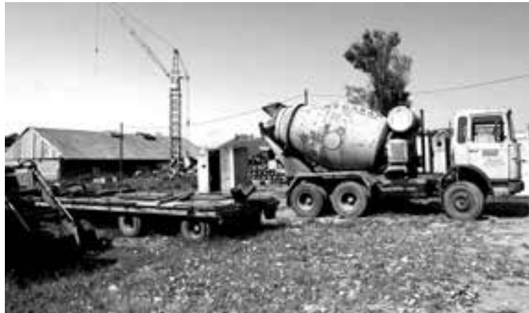
МЕХАНИЗАЦИЈА ГРАЂЕВИНАЦА „КАЗИМИРА ВЕЉКОВИЋА“ У ВРЕМЕ ПРОПАДАЊА

сти су огромни и велики број предузећа је пред банкротством.