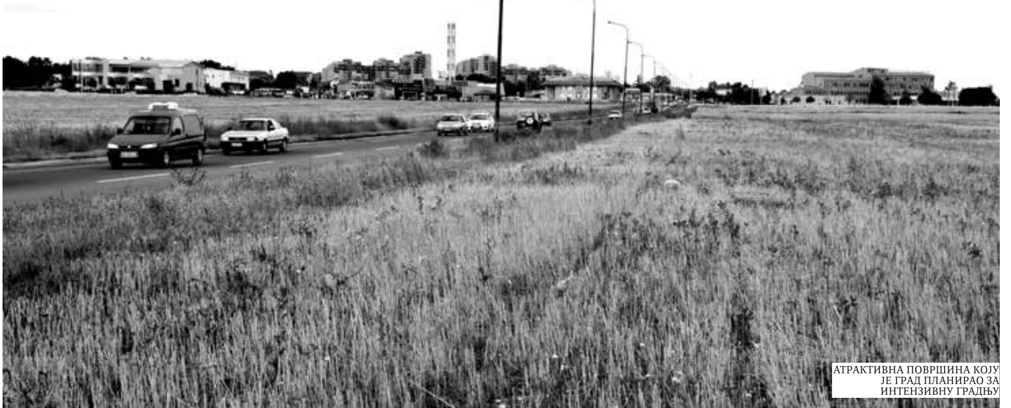
АТРАКТИВНА ПОВРШИНА КОЈУ ЈЕ ГРАД ПЛАНИРАО ЗА ИНТЕНЗИВНУ ГРАДЊУ