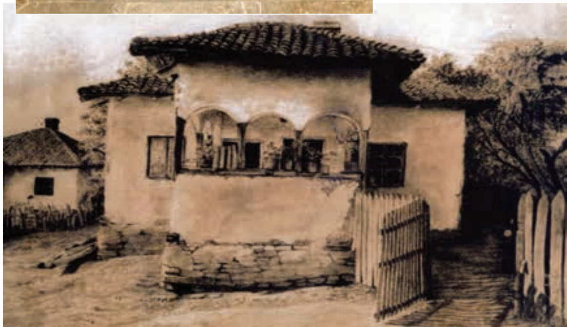
СТАРА КУЋА МИЛУТИНОВИЋА