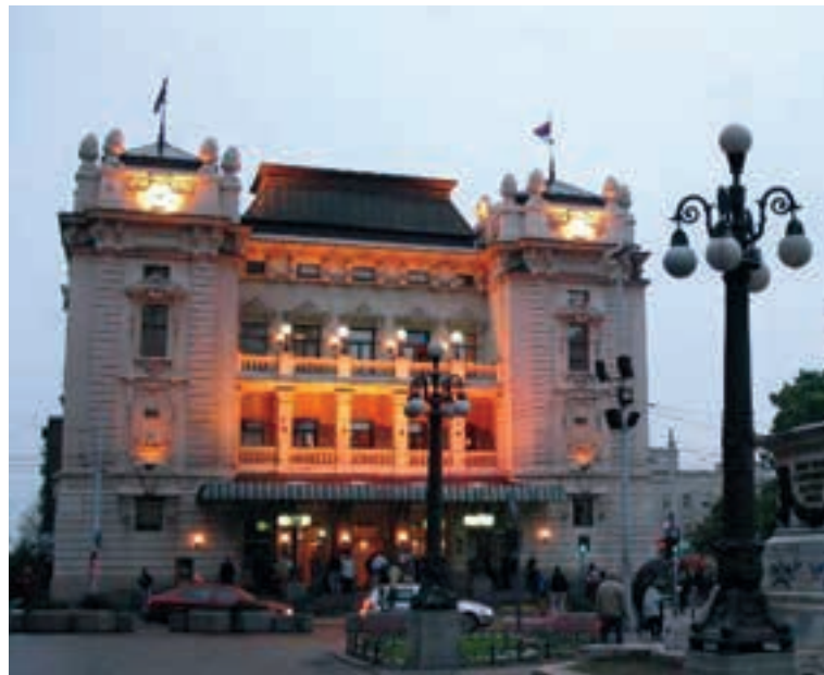
НАРОДНО ПОЗОРИШТЕ У БЕОГРАДУ

Наравно, не сме се заборавити један низ изванредних организација и пројеката (посебно издавачких кућа, часописа и невладиних организација) лоцираних изван главног града, чији значај понекад и превазилази националне оквире, али чији су успеси првенствено резултат индивидуалних способности и упорности њихових покретача и руководилаца, те утолико пре изузетак који потврђује правило него пример политике децентрализације.