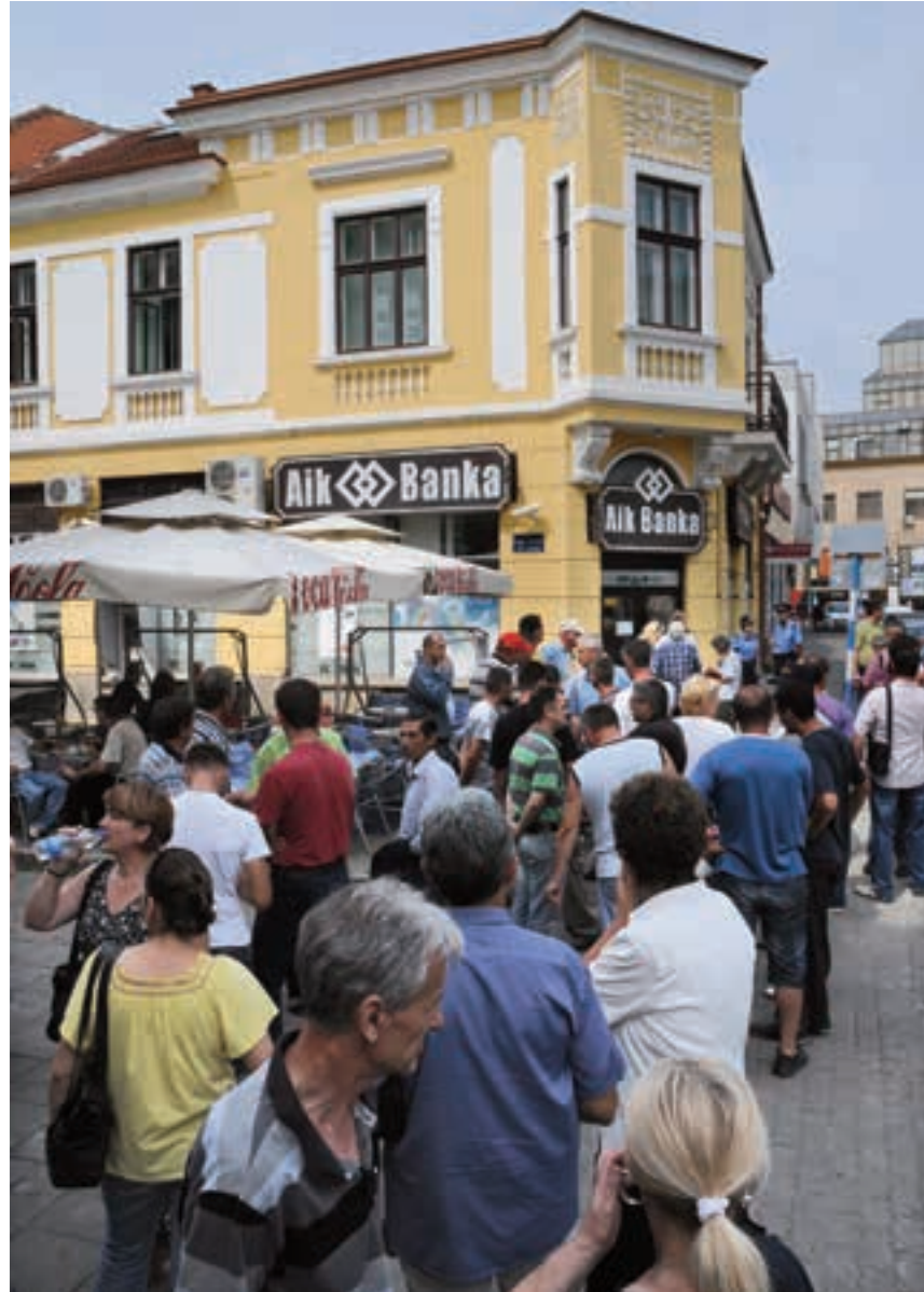
ПРОТЕСТ ИСПРЕД АИК БАНКЕ У КРАГУЈЕВЦУ

Дуг „Нибенс групе“ према АИК банци је близу милијарду динара, а главни инвеститори и дужници за обављене, а ненаплаћене радове, су Јавно предузеће „Путеви Србије“, Министарство за инфраструктуру и „Коридори Србије“.