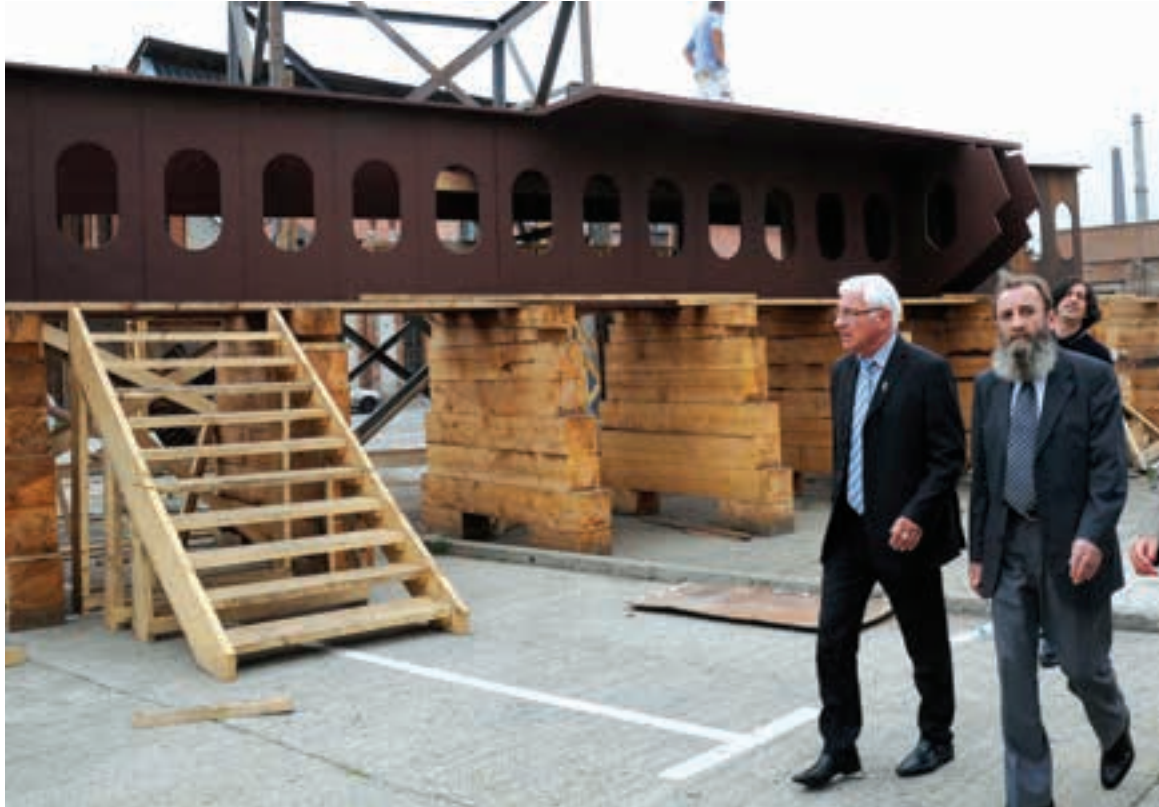
У КНЕЖЕВОМ АРСЕНАЛУ ТРЕНУТНО БРОДОГРАДИЛИШТЕ

Обилазећи само део објеката „Милошевог венца” министар културе Предраг Марковић заложио се да простор Кнежевог арсенала конкурише код европских културних фондова као репрезентативан комплекс индустријске баштине, али је најавио и оправку звоника Старе цркве и завршетак радова на огради Народног музеја