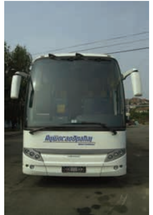
У ЗНАК ИЗВИЊЕЊА, БЕСПЛАТНО ПУТОВАЊЕ ИНВАЛИДА У ДРВЕНГРАД

По његовим речима, представница града Крагујевца која је су-