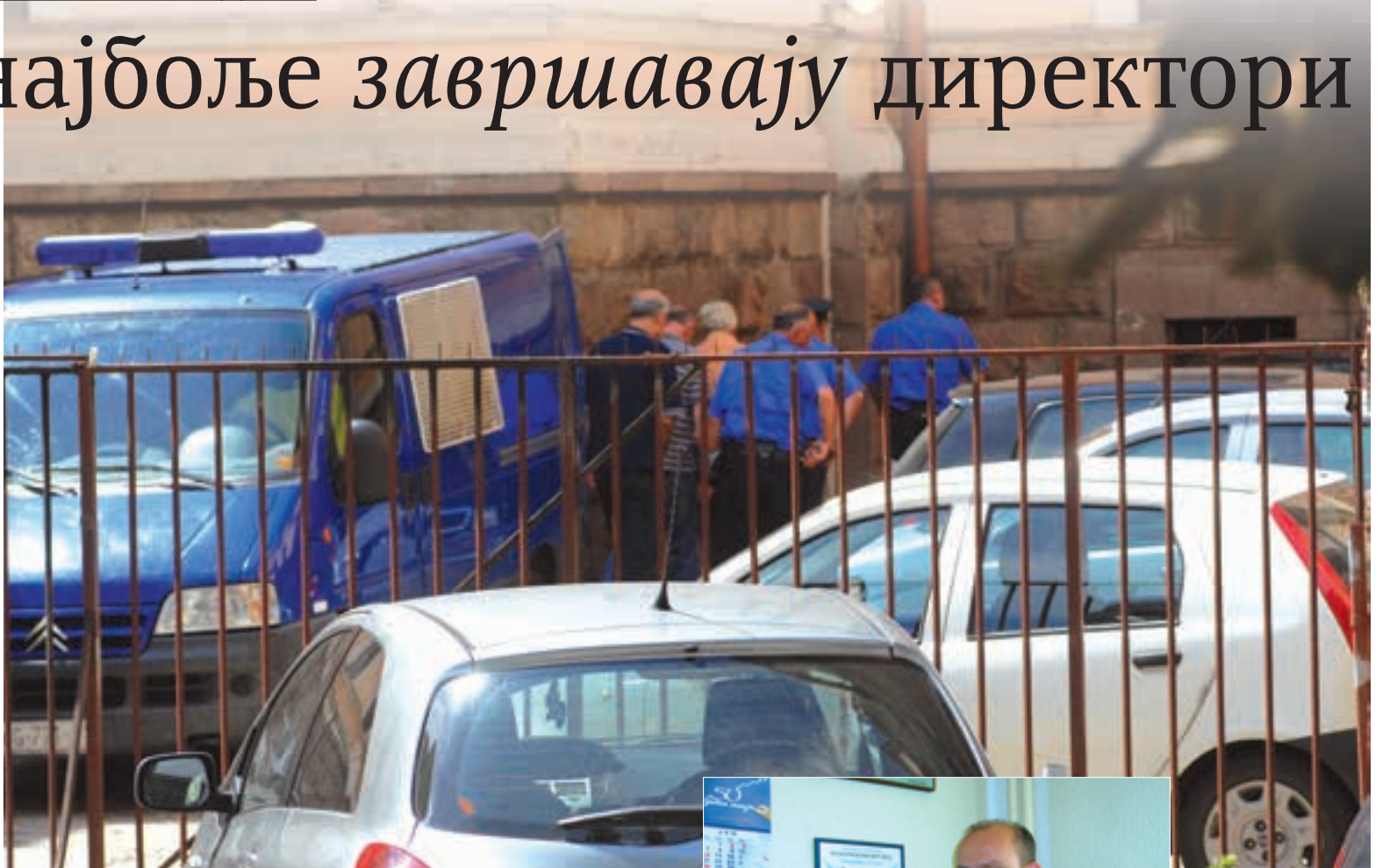
ПРИВОЂЕЊЕ У СУД ГРУПЕ ОСУМЊИЧЕНИХ ЗА КОРУПЦИЈУ ЗА ЛОКАЦИЈУ АУТОМОТО ДРУШТВА